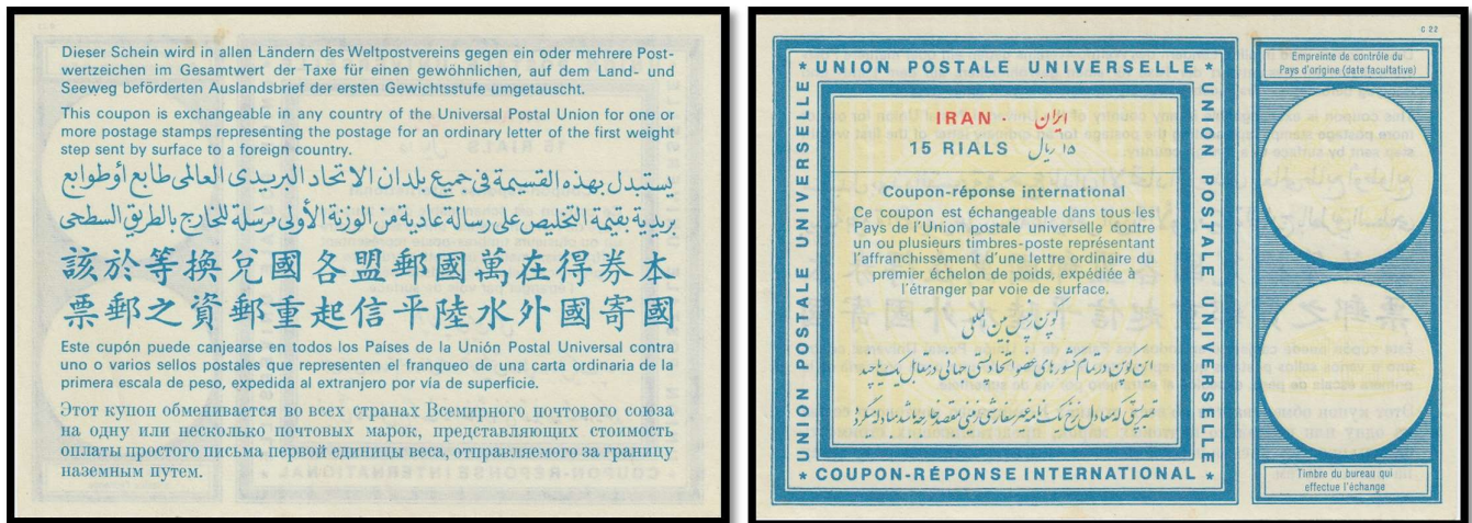
تصویر جلو و پشت کوپن رپنس بین المللی ایران، مدل وین

سومین مدل از کوپن های بین المللی در کنگره اتحادیه جهانی پست در وین در سال ۱۹۶۴ به تصویب رسید و به مدل وین معروف شد. این مدل از کوپن ها دارای ۴ نوع می باشد که از ۱۹۶۶ تا ۱۹۷۵ در جریان قرار گرفت. در این مقاله درباره کوپن های مدل وین بحث خواهیم کرد. اندازه این کوپن ها ۷۴*۱۰۵ میلی متر است. تمام این کوپن ها در شرکت Benziger S.A. در شهر Einsiedeln سوئیس در ورق های ۵۰ تایی در ۱۰ ردیف و ۵ ستون چاپ شدند. نام طراح کوپن Donald Burn، یک گرافیکست آشنا به تمبر شناسی است. در این مدل نام چاپخانه وجود ندارد و کد C22 در گوشه بالا و سمت راست دیده می شود. کوپن های مدل وین تاریخ انقضا ندارند. فیلیگران کوپن نوع اول مدل وین، همانند کوپن لندن یک UPU بزرگ است. فیلیگران کوپن نوع دوم تا چهارم مدل وین تکرار UPU کوچک است. در سمت چپ یک مربع به ضلع ۷۰ میلی متر وجود دارد. در پس زمینه این مربع که به رنگ زرد است خطوط راه راه عمودی وجود دارد و در وسط تصویر کره زمین، کبوتری با بال های گشوده، نامه ای در منقار دارد و به سمت بالا در حال پرواز است. در سمت راست کوپن، دو دایره وجود دارد که دایره بالایی جای مهر زدن کشور صاحب کوپن است با پس زمینه نشان اتحادیه جهانی پست و دایره پایینی جای مهر زدن کشور مبادله کننده کوپن با تمبر است با پس زمینه ساختمان اداری اتحادیه جهانی پست.