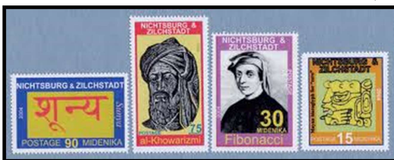
تمبرنمایی با تصویر خوارزمی

در سال ۱۹۵۱ تا ۱۹۶۶ سازمان ملل مجموعه‌ای ۴۱ عددی از تمبرنامه‌ها (سیندرلا یا هدیه) را منتشر نمود که برای جمع آوری پول برای آن سازمان بودند.