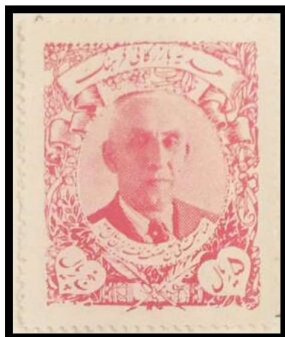
تمبرنمای دکتر محمد مصدق

حالا به طور اختصار در مورد یکی از زیباترین تمبرنماهای سیندرلا برای ایران که در زمان نهضت ملی شدن صنعت نفت ایران بوجود آمد و توسط فعالین نهضت ملی منتشر شد میپردازیم. این تمبرنماها، هدیه شرکت بازرگانی فرهنگ بود. نهضت ملی شدن صنعت نفت از سال ۱۳۲۹ به رهبری دکتر مصدق و آیتاله کاشانی هیجانانگیزی ملی‌گرایی مردم ایران را به اوج رسانده بود و گروهها و جمعیت های مختلف از ایشان حمایت میکردند. این حمایت ها با چاپ مقالات در روزنامه ها، بروشورها و عکسهای تبلیغاتی نمود پیدا می کرد.