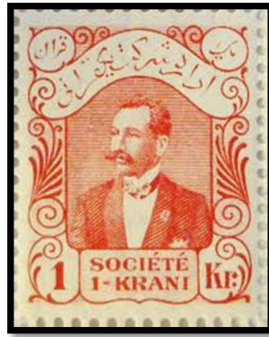
تمبرنمای اداره شرکت یک قرانی

در ایران انتشار تمبرنماهای سیندرلا از دوره قاجار آغاز شد و میتوان به اداره شرکت یک قرانی اشاره کرد که نوعی تمبر تبلیغاتی به حساب می‌آید.