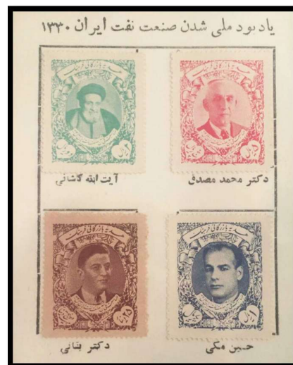
تمبرنمای نهضت ملی شدن نفت

تمبر رسمی مدرکی چاپی است که نشان دهنده پیش پرداخت مبلغی برای خدمات پستی است که معمولاً کاغذی و کوچک و در اشکال مختلف است که دارای چسب خاص که در برخورد با آب خاصیت چسبندگی پیدا می کند. چسباندن تمبر برای یک نامه یا بسته پستی نشان دهنده این است که فرستنده مبالغ کامل یا بخشی از آن را برای ارسال محموله پرداخت کرده است.