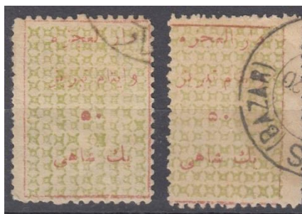
تمبرهای ۱ شاهی از نوع دوم با "ت" و "ب" بلند در تبریز