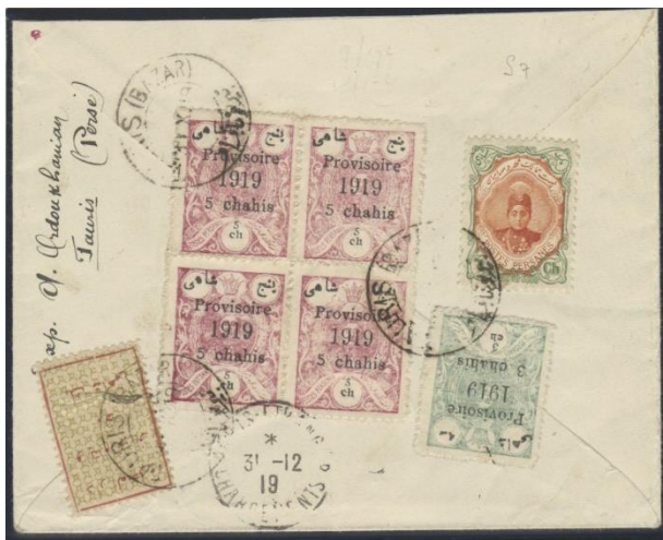
پاکت سفارشی از تبریز به پاریس به تاریخ ۳۱ اکتبر ۱۹۱۹. اولین استفاده از تمبر خیریه ۱ شاهی از نوع دوم.

نوع سوم: تمبر یک شاهی با کادر قرمزشنگرفی ضخیم و زمینه آبی. در این تمبر بر خلاف نوع اول و دوم، مبلغ اسمی تمبر با عدد به صورت "۱ شاهی" نوشته شده. در هر ورق ۲۵ تایی از این نوع تمبر، دو نوع ۵ کوچک و بزرگ در ۵۰ دینار دیده شده که البته با ۵ بزرگ کمیابتر از نوع ۵ کوچک است. همچنین (در هر ورق ۲۵ تایی) دو نوع "تبریز" با "ت" بلند و کوتاه وجود دارد. اولین استفاده از این تمبر به تاریخ ۱۲ آگوست ۱۹۲۰ بوده است.