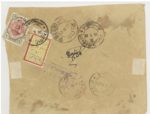
پاکت از تبریز به تهران از راه رشت به تاریخ ۲۸ اکتبر ۱۹۱۸. اولین استفاده از تمبر خیریه ۱ شاهی نوع اول.