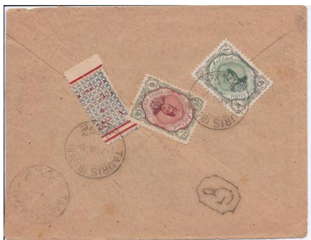
پاکت از تبریز به همدان به تاریخ ۱۲ آگوست ۱۹۲۰. اولین استفاده از تمبر خیریه ۱ شاهی از نوع سوم (۵ بزرگ).