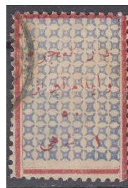
"ت" بلند و ۵ کوچک