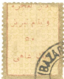
تمبر ۱ شاهی از نوع دوم با دور طلایی که فقط یک نمونه از آن تا به حال دیده شده

نوع دوم: تمبر یک شاهی با کادر قرمز نازک (حدود ۱ میلیمتر) و زمینه سبز. زمینه این تمبرها از کنار هم قرار گرفتن چهار ضلعیهای مقعر با اضلاع قوسی در ۱۲ ردیف و ۹ ستون تشکیل شده است. در نتیجه این تمبرها عریضتر از دیگر تمبرهای دارالعززه می‌باشند. در این تمبرها حرف "ب" در تبریز به دو شکل بلند و کوتاه همانند شکل زیر دیده شده. اولین استفاده از این تمبر به تاریخ ۳۱ اکتبر ۱۹۱۹ بوده است.