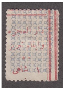
ت کوچک و ۵ که تاه