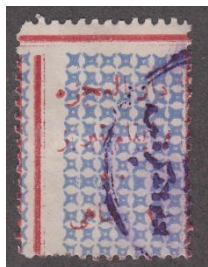
این تمبر در گذرنامه استفاده شده است.

نوع سوم: تمبر یک شاهی با کادر قرمزشنگرفی ضخیم و زمینه آبی. در این تمبر بر خلاف نوع اول و دوم، مبلغ اسمی تمبر با عدد به صورت "۱ شاهی" نوشته شده. در هر ورق ۲۵ تایی از این نوع تمبر، دو نوع ۵ کوچک و بزرگ در ۵۰ دینار دیده شده که البته با ۵ بزرگ کمیابتر از نوع ۵ کوچک است. همچنین (در هر ورق ۲۵ تایی) دو نوع "تبریز" با "ت" بلند و کوتاه وجود دارد. اولین استفاده از این تمبر به تاریخ ۱۲ آگوست ۱۹۲۰ بوده است.