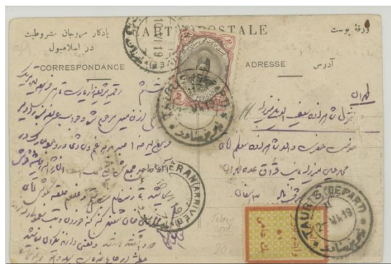
تمبر خیریه ۱ شاهی از نوع اول روی کارت پستی به تاریخ ۲ ژوئن ۱۹۱۹.

نوع دوم: تمبر یک شاهی با کادر قرمز نازک (حدود ۱ میلیمتر) و زمینه سبز. زمینه این تمبرها از کنار هم قرار گرفتن چهار ضلعیهای مقعر با اضلاع قوسی در ۱۲ ردیف و ۹ ستون تشکیل شده است. در نتیجه این تمبرها عریضتر از دیگر تمبرهای دارالعززه می‌باشند. در این تمبرها حرف "ب" در تبریز به دو شکل بلند و کوتاه همانند شکل زیر دیده شده. اولین استفاده از این تمبر به تاریخ ۳۱ اکتبر ۱۹۱۹ بوده است.