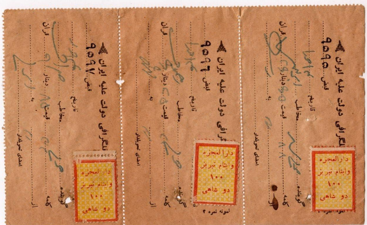
سه رسید تلگراف همراه با تمبر ۲ شاهی دارالعجزه. تمبر سمت راست دارای ۱ و ارونه است. مجموعه آقای توحید خطیبی.