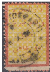
"ت" بلند در تبریز