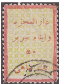
"ت" و "ب" کوتاه در تبریز

نوع اول: تمبر یک شاهی با کادر قرمز ضخیم (حدود ۲/۵ میلیمتر) و زمینه سبز زیتونی. این تمبرها عمدتاً با دقت چاپ شده و حروف "ت" و "ب" در کلمه تبریز در دو نوع بلند و کوتاه همانند شکل زیر دیده شده اند. همچنین در موارد معدودی کلمه اینام بدون حرف "الف" دیده شده. اولین استفاده از این تمبر به تاریخ ۲۸ اکتبر ۱۹۱۸ بوده است.