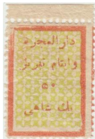
"ب" بلند و نبود نقطه‌های "ی" در تبریز