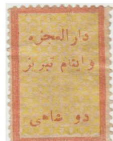
بدون نوشته ۱۰۰