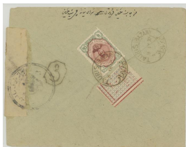
پاکت با تمبر خیریه ۱ شاهی نوع سوم یا ۵ کوچک.