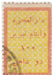
۱ و ارونه در ۱۰۰