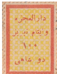
"ب" بلند در تبریز

ب) تمبر دو شاهی با کادر قرمز ضخیم و زمینه زرد. این تمبرها عمدتاً روی رسید تلگراف، اسناد قضایی، گذرنامه‌ها و رسید امانات دیده میشوند. واریته‌های این تمبرها شامل تمبر بدون نوشته ۱۰۰ و همچنین نوشته ۱۰۰ با ۱ و ارونه است. این تمبرها نیز عمدتاً با دقت چاپ شده و حروف "ت" و "ب" در کلمه تبریز همانند تمبر ۱ شاهی نوع اول در دو نوع بلند و کوتاه وجود دارد.