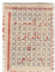
ت بلند و ۵ کوتاه