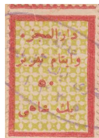
این تمبر در سند قضایی مصرف شده. "ب" بلند در تبریز