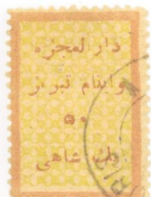
"ت" بلند و نبود نقطه‌های "ی" در تبریز